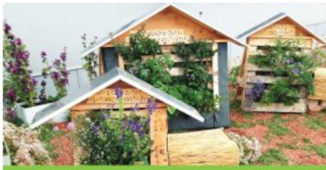
Bienen und andere Nützlinge fördern Nisthilfen und Unterkünfte für Nützlinge am Balkon und im Garten

Nützlinge sind kleine Lebewesen wie Ohrwürmer, Florfliegen oder Marienkäfer, aber auch größere wie Igel, Eidechsen und Vögel. Sie halten Schädlinge auf natürliche Weise im Zaum.