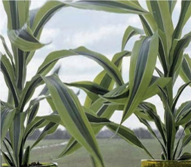
Drachenbaum - Dracaena fragrans

Allergiker*innen und andere empfindlich reagierende Personen sollten bei der Pflege und vor allem beim Umtopfen von Pflanzen Gummihandschuhe tragen, denn auch eine Berührung kann Hautreizungen hervorrufen.