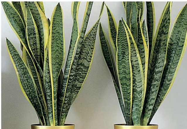
Bogenhanf - Sansevieria trifasciata

Kohlenmonoxid beeinträchtigt als Atemgift den Sauerstofftransport im menschlichen Körper. Es ist auch im Zigarettenrauch enthalten. Auch die Menschen selbst geben Schadstoffe an die Luft ab. Russische Weltraumforschungen ergaben, dass Menschen außer Kohlendioxid bis zu 150 weitere flüchtige Stoffe abgeben, z. B. Kohlenmonoxid, Wasserstoff, Methan, Alkohole, Phenole, Ammoniak oder Schwefelwasserstoff.