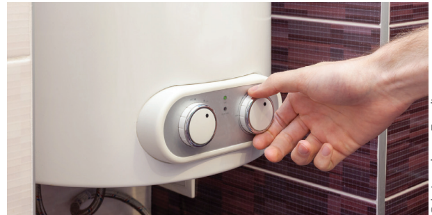
Temperatureinstellung beim Speicher

Eine Photovoltaikanlage erzielt vor allem in der warmen Jahreszeit gute Stromerträge. Etwaige Stromüberschüsse können auch für die Warmwasserbereitung verwendet werden, statt sie ins öffentliche Stromnetz einzuspeisen. Eine besonders energieeffiziente Form ist die Produktion von Warmwasser mit einer Wärmepumpe, die mit Photovoltaikstrom versorgt wird. Ist keine Wärmepumpe vorhanden, kann der Solarstrom auch das Wasser mit einer Elektro-Patrone im Warmwasserspeicher erwärmen. Sollte im Warmwasserspeicher keine Elektropatrone eingebaut sein, ist eine Nachrüstung erforderlich.